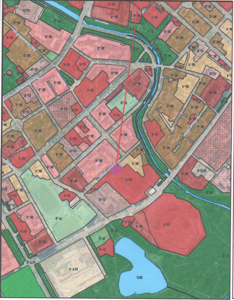
Схема расположения земельного участка на карте градостроительного зонирования М 1:10 000

Красные линии в пределах ПМТ - отсутствуют Территории объектов культурного наследия в пределах ПМТ - отсутствуют Зоны действия публичных сервитут в пределах ПМТ - отсутствуют