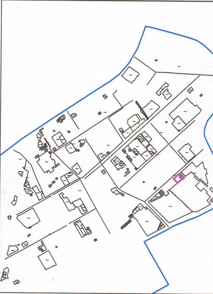
Схема расположения земельного участка в границах элемента планировочной структуры (квартале) М 1:10 000