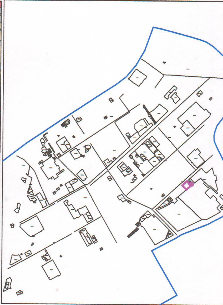
Схема расположения земельного участка на карте градостроительного зонирования М 1:10 000