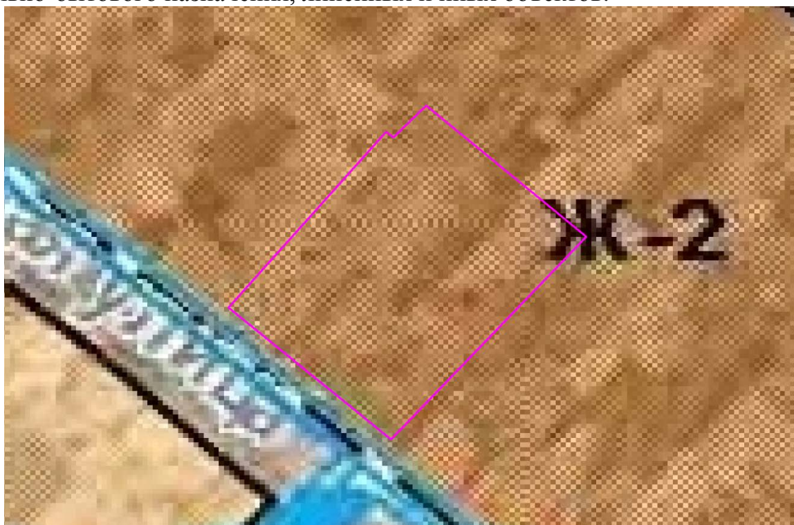
Рис. 1. Схема расположения проектируемого земельного участка относительно территориальных зон.

В зонах застройки малоэтажными многоквартирными жилыми домами допускается размещение объектов, связанных с проживанием граждан и не оказывающих негативного воздействия на окружающую среду, а также стоянок, гаражей, площадок для временной парковки автотранспорта, объектов социального, коммунально-бытового назначения, линейных и иных объектов.