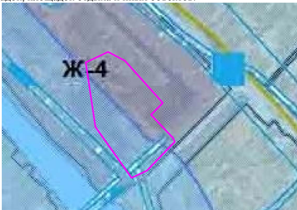
Рис. 1. Схема расположения проектируемого земельного участка относительно территориальных зон.

В зонах жилой многоэтажной застройки допускается размещение объектов, связанных с проживанием граждан и не оказывающих негативного воздействия на окружающую среду, размещение подземных гаражей и автостоянок; спортивных и детских площадок, площадок отдыха и иных объектов.