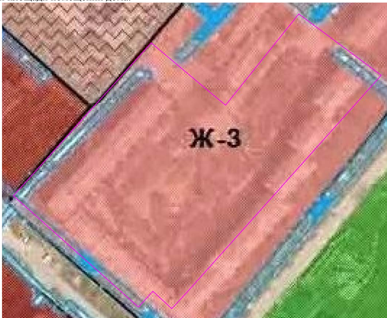
Рис. 1. Схема расположения проектируемого земельного участка относительно территориальных зон.

В зонах застройки среднеэтажными жилыми домами допускается размещение объектов, связанных с проживанием граждан и не оказывающих негативного воздействия на окружающую среду, а также размещение подземных гаражей и автостоянок; обустройство спортивных и детских площадок, площадок отдыха и иных объектов в случаях, предусмотренных настоящей статьей. Объектов обслуживания жилой застройки во встроенных, пристроенных и встроенно-пристроенных помещениях многоквартирного дома, должно быть не более 20% от общей площади помещений дома.