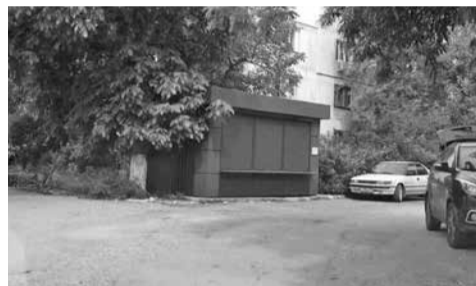
Управлением торговли и бытового обслуживания населения, устанавливается собственник нестационарного объекта, расположенного по адресу: г. Симферополь, ул. Спортивная, 7 (фотофиксация прилагается, приложение № 1);

Для получения дополнительной информации обращаться в Департамент административно-технического контроля Администрации города Симферополя Республики Крым по адресу: г. Симферополь, ул. 60 лет Октября, 13/64, тел. (3652) 534-128».