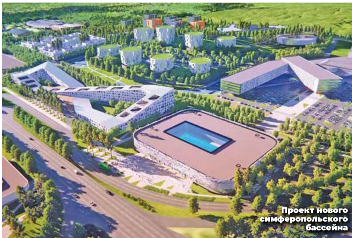
Проект нового симферопольского бассейна

В настоящее время Министрство курортов и туризма Республики Крым проводит широкомасштабные мероприятия по подготовке и проведению высокого курортного сезона 2022 года. Забронировать отдых в Крыму можно как через российские системы бронирования, так и непосредственно на сайтах средств размещения. Верифицировать выбранный отель или санаторий позволяет действующая Горячая линия Минкурортов РК: 88005118018.