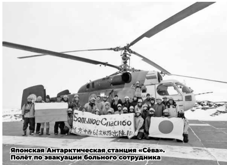
Японская Антарктическая станция «Сёва». Полёт по эвакуации больного сотрудника

— Конечно. Самые интересные рассказы я услышал на станции «Восток», которая является самой недоступной и экстремальной. Из-за перепада температур там тяжело даже просто выйти на улицу и сделать несколько шагов. Особенно для неподготовленных людей. У каждого из специалистов свои задачи, связанные с научными исследованиями, обеспечением работы станции. Сами понимаете какие могут быть отношения у экипажа, где около 20 человек живут вместе и работают в команде. Есть положительные моменты, есть и отрицательные. Тем не менее, когда все живы и здоровы, когда заканчивается зимовка, а вместе с ней и командировка, то все они чувствуют себя замечательно. Самое важное в Антарктиде — это люди, особенно те, которые работают там не один год. У каждого из них