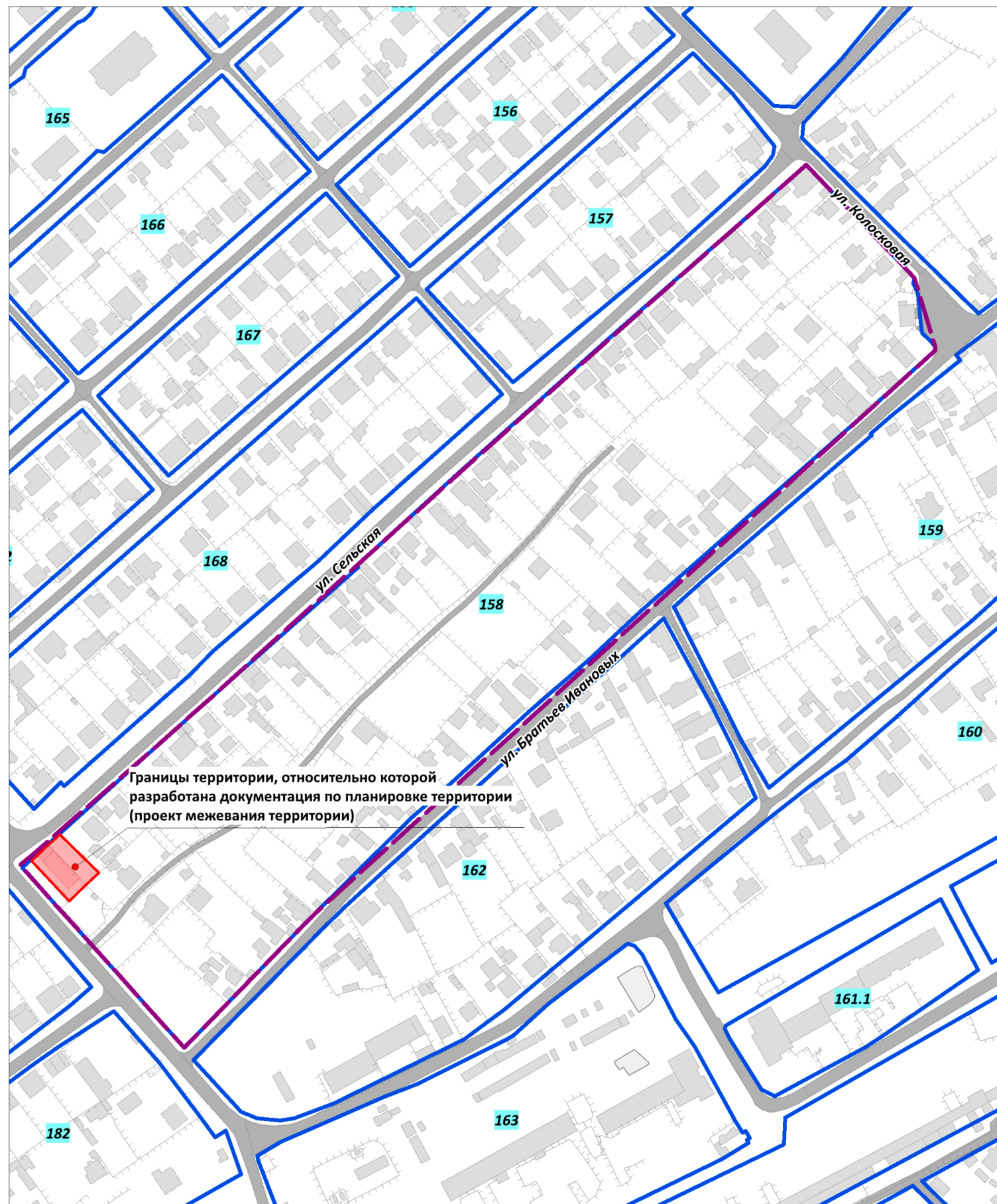
ЧЕРТЕЖ МЕЖЕВАНИЯ ТЕРРИТОРИИ М 1:500