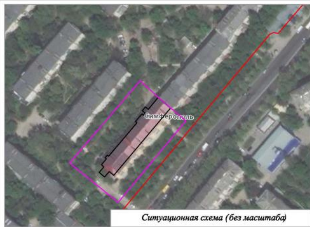
Ведомость координат поворотных точек границ образуемого земельного участка