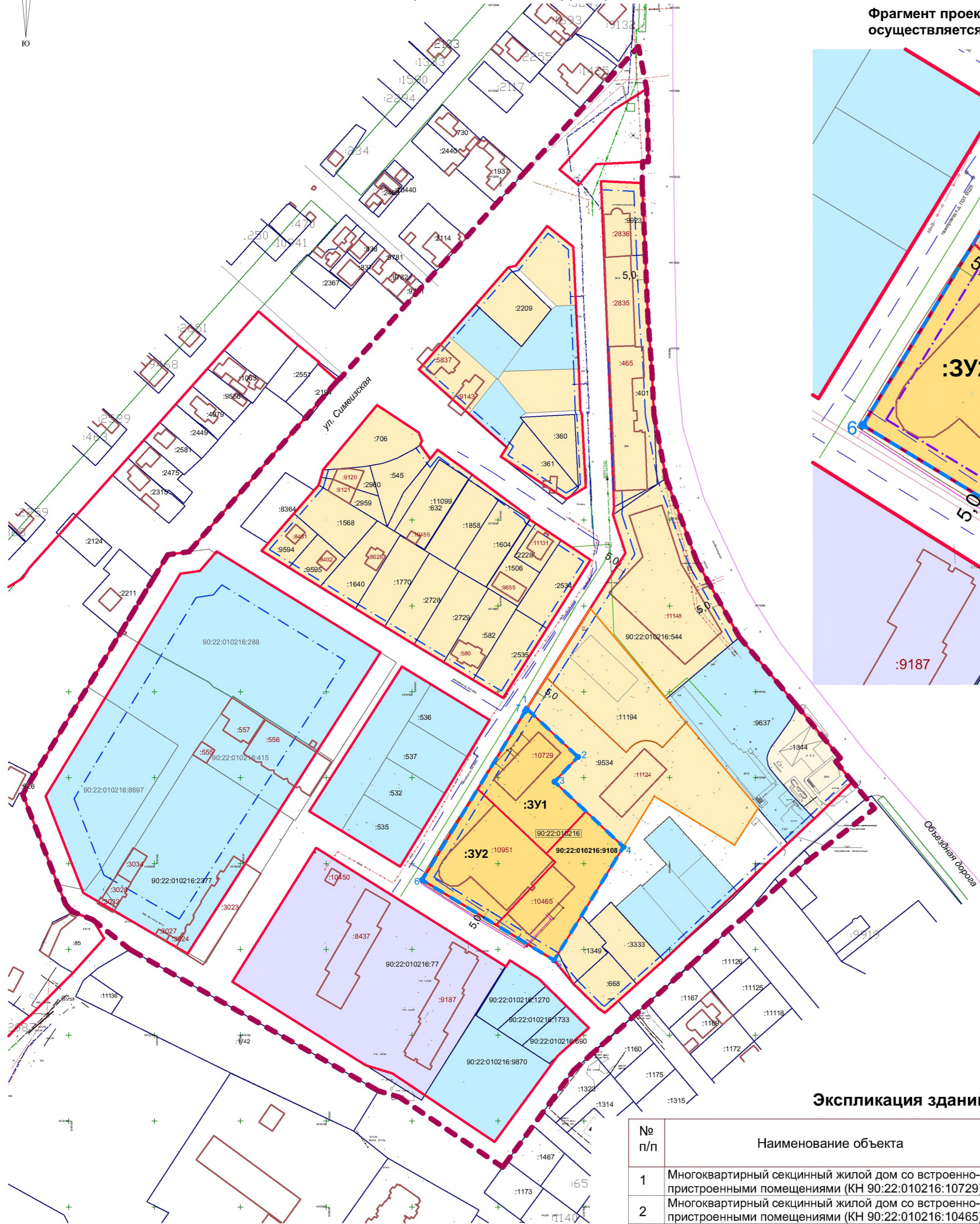
Фрагмент проектируемой территории, применительно к которой осуществляется подготовка документации М 1:1 000