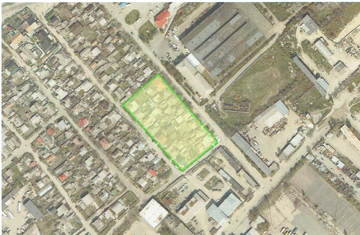
Схема территории проектирования