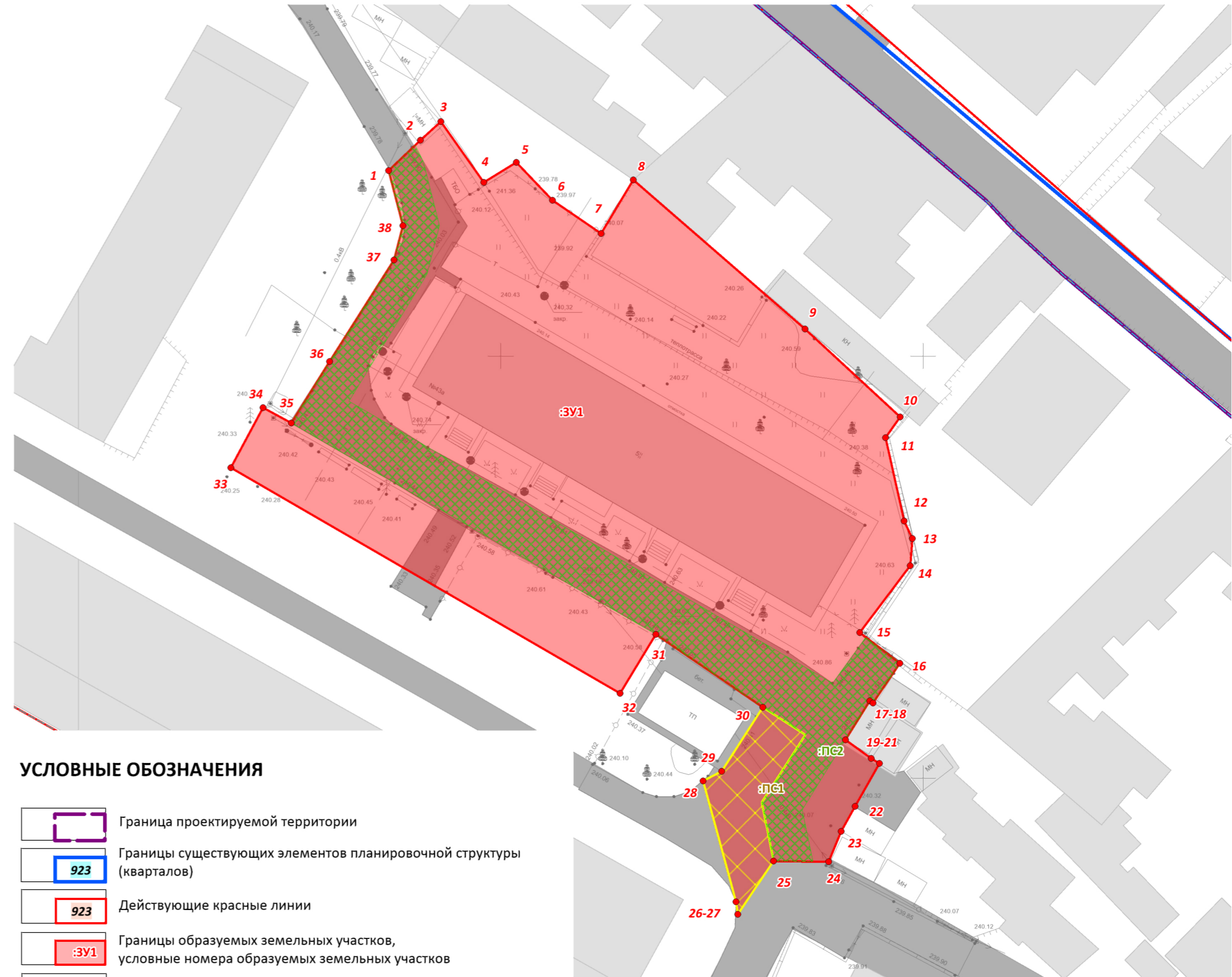
ФРАГМЕНТ ЧЕРТЕЖА МЕЖЕВАНИЯ ТЕРРИТОРИИ М 1:500

Примечания: 1. Сведения об образуемых земельных участках приведены в подразделе 1.1 Текстовой части Основной части проекта межевания территории. 2. Ведомость координат характерных точек границ образуемых земельных участков приведена в пункте 1.1.4 подраздела 1.1. Текстовой части Основной части проекта межевания территории. 3. Границы существующих публичных сервитутов в границах проектируемой территории отсутствуют согласно сведениям Единого государственного реестра недвижимости. 4. Проектными предложениями по межеванию территории установлены границы публичного сервитута в целях эксплуатации объекта электросетевого хозяйства – трансформаторной подстанции в соответствии со статьей 39.37 Земельного кодекса Российской Федерации. 5. Проектными предложениями по межеванию территории установлены границы частного сервитута для земельного участка, расположенного по ул. Зои Жильцовой, з/у 7 (КН 90:22:010218:6069) в целях прохода или проезда через образуемый земельный участок. 6. Сведения о границах устанавливаемых сервитутов приведены в подразделе 1.6. Текстовой части Основной части проекта межевания территории. 7. Действующие красные линии установлены Документацией по внесению изменений в утвержденную документацию по планировке территории муниципального образования городской округ Симферополь Республики Крым в части прохождения красных линий, утвержденной Постановлением Администрации города Симферополя Республики Крым от 14.11.2019 № 6070.