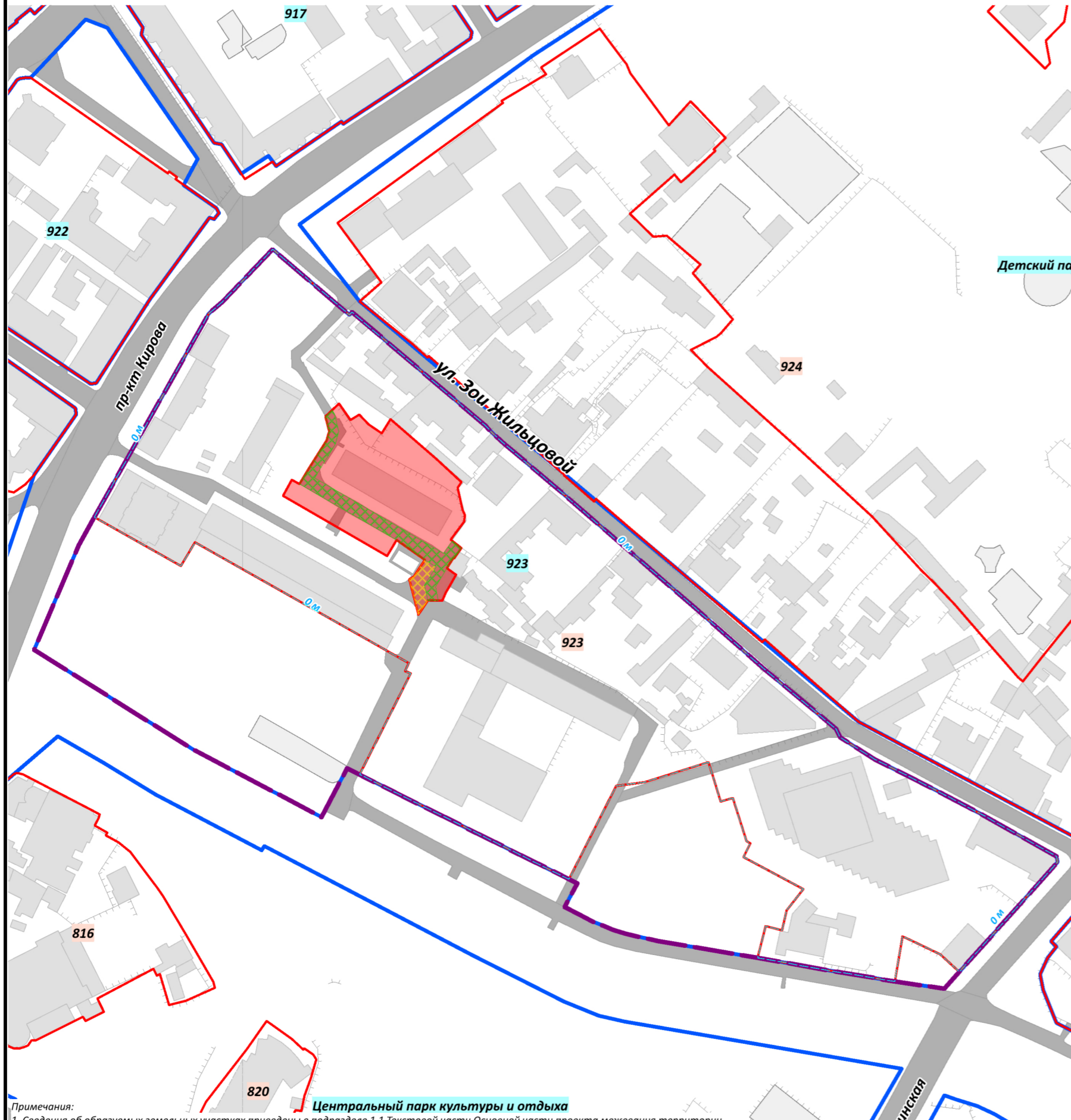
ЧЕРТЕЖ МЕЖЕВАНИЯ ТЕРРИТОРИИ М 1:2000

Примечания: 1. Сведения об образуемых земельных участках приведены в подразделе 1.1 Текстовой части Основной части проекта межевания территории. 2. Ведомость координат характерных точек границ образуемых земельных участков приведена в пункте 1.1.4 подраздела 1.1. Текстовой части Основной части проекта межевания территории. 3. Границы существующих публичных сервитутов в границах проектируемой территории отсутствуют согласно сведениям Единого государственного реестра недвижимости. 4. Проектными предложениями по межеванию территории установлены границы публичного сервитута в целях эксплуатации объекта электросетевого хозяйства – трансформаторной подстанции в соответствии со статьей 39.37 Земельного кодекса Российской Федерации. 5. Проектными предложениями по межеванию территории установлены границы частного сервитута для земельного участка, расположенного по ул. Зои Жильцовой, з/у 7 (КН 90:22:010218:6069) в целях прохода или проезда через образуемый земельный участок. 6. Сведения о границах устанавливаемых сервитутов приведены в подразделе 1.6. Текстовой части Основной части проекта межевания территории. 7. Действующие красные линии установлены Документацией по внесению изменений в утвержденную документацию по планировке территории муниципального образования городской округ Симферополь Республики Крым в части прохождения красных линий, утвержденной Постановлением Администрации города Симферополя Республики Крым от 14.11.2019 № 6070.